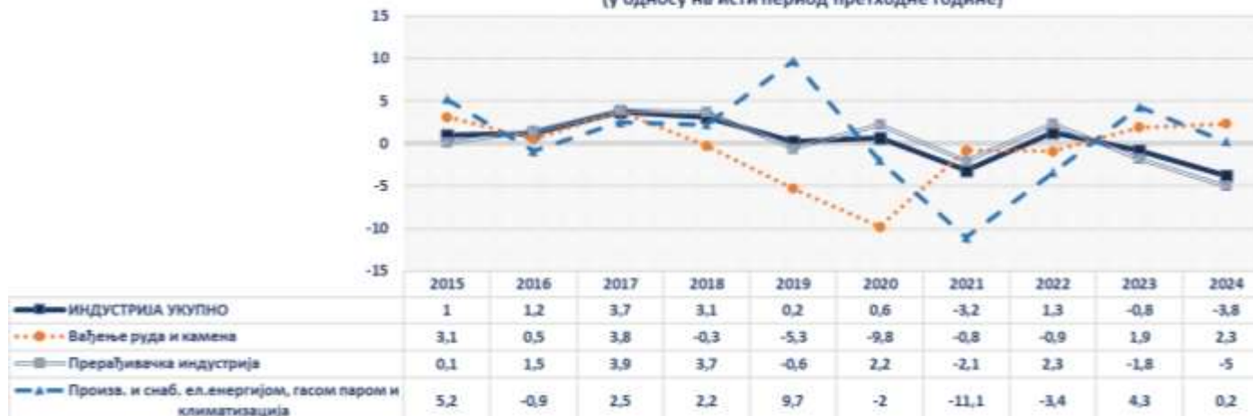
Стопе промјене запослености у индустрији за период јануар-март (у односу на исти период претходне године)