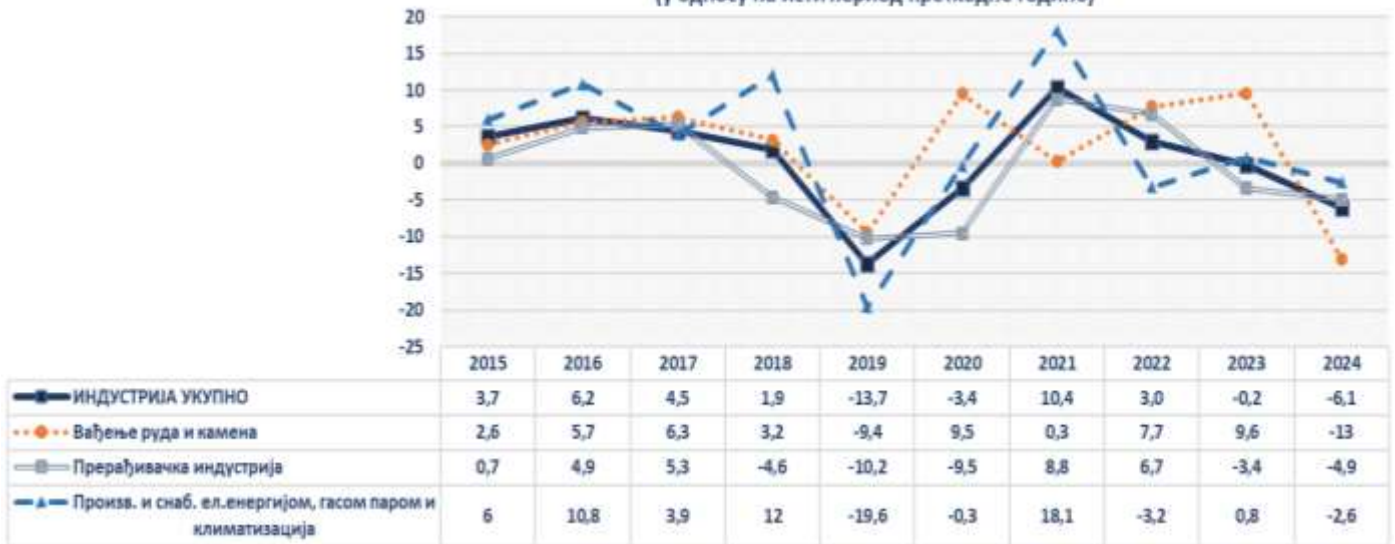
Стопе промјене индустријске производње за период јануар-март (у односу на исти период претходне године)

* Главне индустријске групе дефинисане на основу економске намјене производа