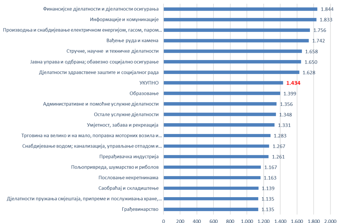
7. Табела: Номинални и реални индекси плата након опорезивања